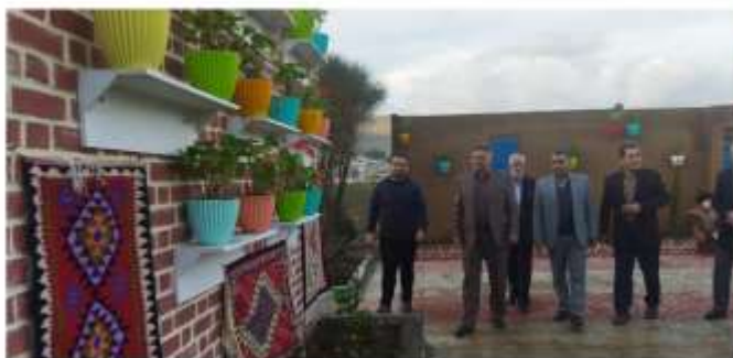
بازدید شورای اداری شهرستان از سفره نوروزی و عملکرد شهرداری اسلام آباد غرب در فروردین ۱۴۰۲