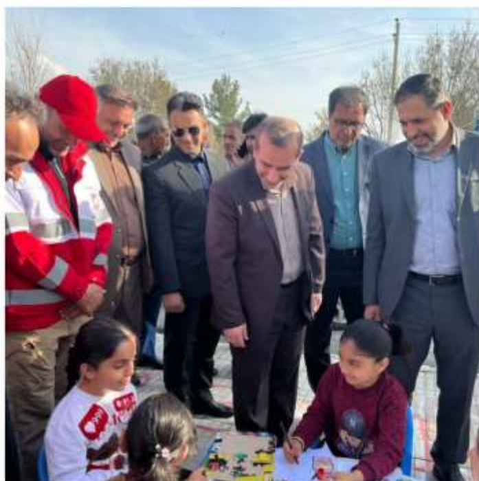
بازدید استاندار کرمانشاه و هیئت همراه از سفره نوری و عملکرد شهرداری اسلام آباد غرب در فروردین ۱۴۰۲