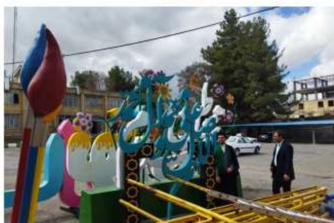
بازدید شورای اداری شهرستان از سفره نوروزی و عملکرد شهرداری اسلام آباد غرب در فروردین ۱۴۰۲